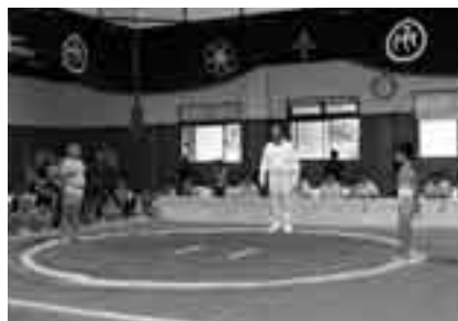
健康作りに、イベントに

4月分から、市の体育施設利用の抽選がインターネットで行われます。 インターネット抽選を行う施設 ○中台運動公園…アリーナ・剣道場・柔道場・弓道場・相撲場・野球場・球技場・テニスコート ○大谷津運動公園…野球場・多目的広場・テニスコート ○北羽鳥多目的広場 ○久住テニスコート 申込期間(4月利用分) ＝2月1日(金)～10日(日) ※初めての人は登録が必要です。本人確認できるものを持って市体育館で手続きしてください。くわしくは市体育館(☎26-7251)へ。