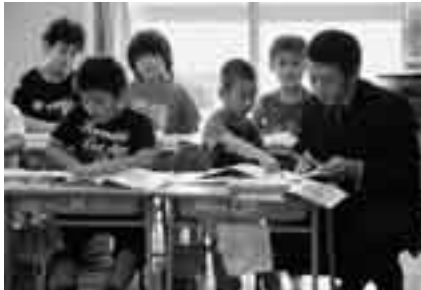
個性を生かす教育を目指して