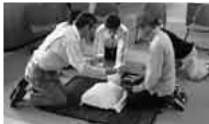
AEDの操作方法を学ぶ

※申し込みは消防本部警防課(☎20-1592)へ。まなび&ボランティアサイト( http://www.genki365.com/narita )からも申し込みができます。