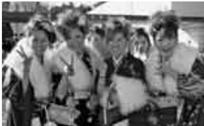
懐かしい人との再会も

期日＝1月14日(月・祝) 時間＝午前10時5分から(受け付けは午前9時30分から) 会場＝国際文化会館 対象＝昭和62年4月2日～昭和63年4月1日に生まれた市内在住の人・市内中学校を卒業した人 ※対象となる人には案内状を送っています。転出した人には送っていませんのでご連絡ください。くわしくは生涯学習課(☎20-1583)へ。