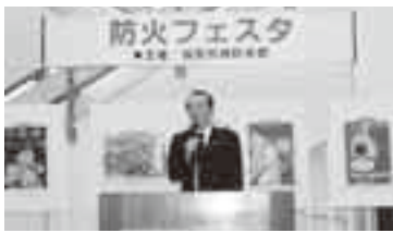
防火フェスタであいさつする小泉市長