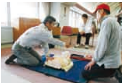
AEDの操作方法是必見です

日時=11月25日(日) 午前9時~正午 会場=市役所6階大会議室 内容=心肺蘇生法・AED(自動体外式除細動器)の操作方法など 定員と参加費=30人(先着順)・無料 ※受講した人には講習修了証が交付されます。申し込みは消防本部警防課(☎20-1592)または、まなび&ポランティアサイト( http://www.genki365.com/narita )へ。