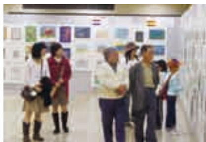
世界各国の絵画が一堂に展示されます

世界各地の子どもたちと市内の子どもたちの絵画作品を通して、お互いの生活や文化について交流を深めます。 期間=11月11日(日)まで 時間=午前9時~午後3時30分 会場=成田山新勝寺大本堂第二講堂 入場料=無料 ※くわしくは生涯学習課(☎20-1583)へ。