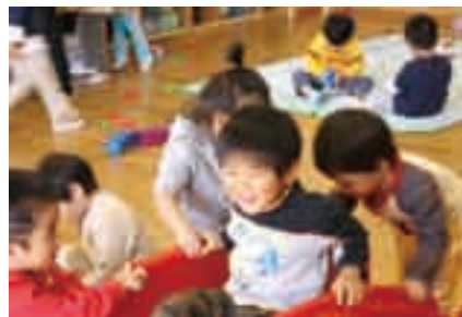
ともだち何人できるかな!

入園資格 ○5歳児…平成14年4月2日~15年4月1日生まれ ○4歳児…平成15年4月2日~16年4月1日生まれ 入園料・保育料など ○入園料…4,000円 ○保育料…月額6,000円(8月は除く) ○給食費…月額2,800円(8月は除く) ○送迎バス代(希望者のみ。運行は大栄地区および成井周辺)…月額2,500円(8月は除く) 願書配布期間と場所=11月12日(月)~16日(金)・大栄幼稚園、学務課(市役所5階)、下総・大栄支所総務課 申込方法=11月29日(木)~12月5日(水)(土・日曜日を除く)の午前9時~午後4時30分に大栄幼稚園(面接を行いますので子ども同伴でお越しください)へ 体験入園(20年度入園予定者対象) 参加を希望する人は前日までに大栄幼稚園に連絡してください。当日は保護者同伴でお子さんの上靴をご用意ください。 期日=11月15日(木)、12月10日(月)、1月24日(木)、2月6日(水) 時間=午前9時30分~11時 ※くわしくは大栄幼稚園(☎73-8005)へ。