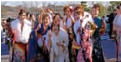
懐かしいメンバーで楽しいひとときを

対象=昭和62年4月2日~昭和63年4月1日に生まれた人で市内に在住している人と市内の中学校を卒業した人 日時=1月14日(月・祝) 午前9時30分 受付開始 会場=国際文化会館 ※市内に住んでいる人には12月初旬に案内状を送付します。転出した人には案内状が届きませんのでご連絡ください。くわしくは生涯学習課(☎20-1583)へ。