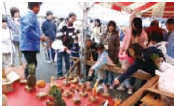
狙いを定めておいしい賞品をゲット!

収穫の秋、食欲の秋。今年も秋の恒例イベント「産業まつり」が、国際文化会館を会場に開かれます。このまつりでは、農家の皆さんが丹精込めて育てた農産物の共進会や伝統工芸品の展示をはじめ、即売会、特別企画とイベントが盛りだくさん。家族そろって秋の一日を楽しんでみませんか。