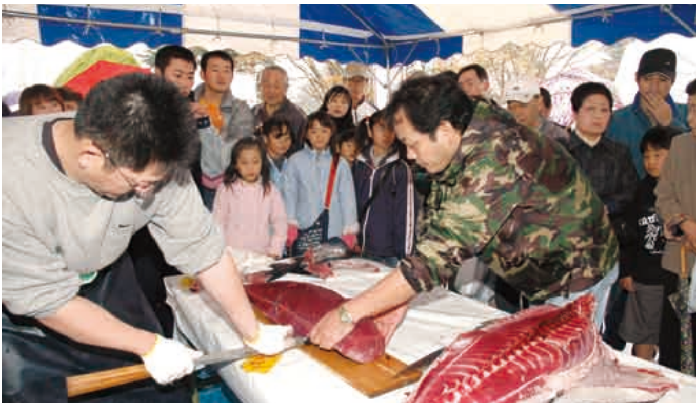
マグロの解体実演販売は人気イベントの一つ