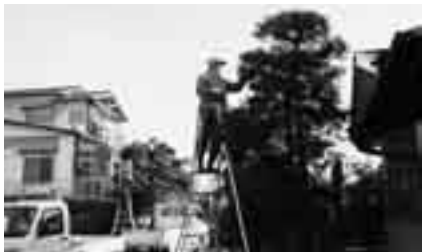
能力を生かして活躍してみませんか