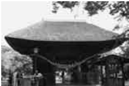
成田の文化財を間近で(龍正院・仁王門)