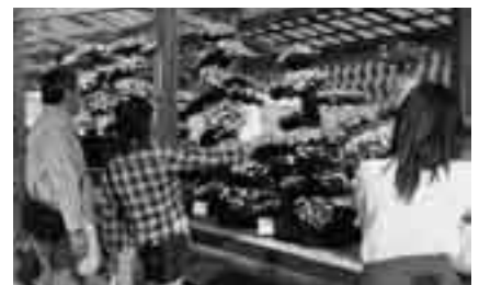
多種多様な菊花を展示