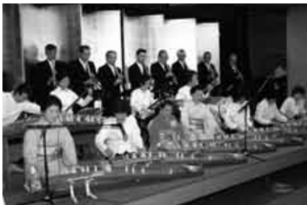
日ごろの練習の成果を披露