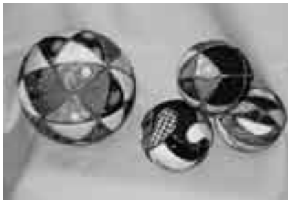
完成したときの達成感は格別です

※申し込みは午前9時～午後5時に八生公民館(☎27-1533、月曜日・9月18日(火)・25日(火)は休館)へ。