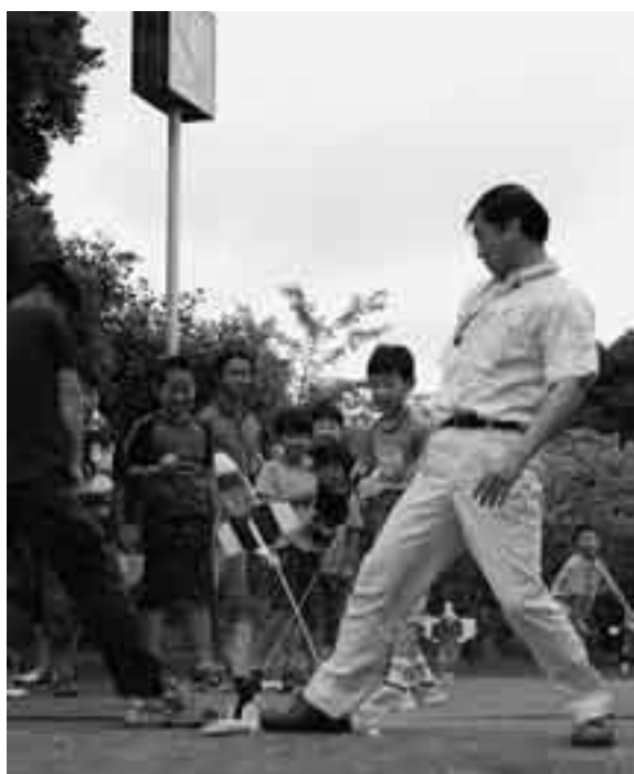
行き先はロケットに聞いて