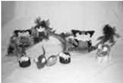
きっとお気に入りの作品ができますよ

※申し込みは午前9時～午後5時に加良部公民館(☎28-7961、月曜日・9月18日(火)・25日(火)は休館)へ。