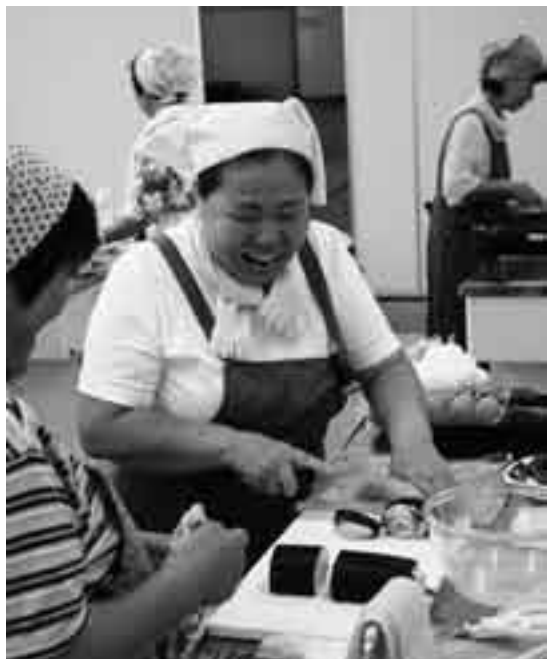
家族の喜ぶ顔が見たくて

保健福祉館大栄分館で8月20日、「おふくろの味教室」が行われました。大栄農家生活改善研究会が、誰もがほっと落ち着く“おふくろの味”を地域の人たちに伝えようというもの。参加者は巻き寿司の出来栄えについて「バッチリだよ」と笑顔で話していました。