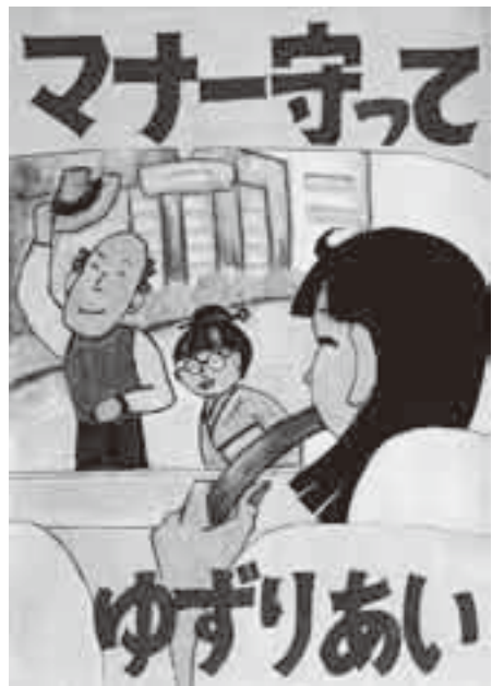
昨年の市長賞受賞作品(小学校高学年の部)