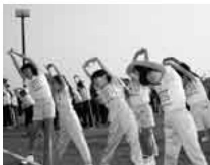
念入りにウォーミングアップしよう

時間＝午前8時～正午 内容＝走路の監察・選手の安全確保(スタッフジャンパーを支給します) 対象＝高校生以上 ※くわしくはPOPラン大会事務局(生涯スポーツ課・☎20-1584)へ。