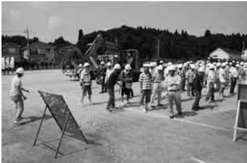
自主防災会による初期消火訓練

マグニチュード7.2規模の直下型地震が市内で発生したことを想定して、8月26日、美郷台小学校と松子地先のふれあいの丘街区公園を会場に総合防災訓練が行われました。この訓練は大地震に対する市民の防災意識の高揚と防災行動力の向上を図ることを目的としたもので、約900人の参加者は防災関係機関との連携協力を図りながら、各訓練に取り組みました。