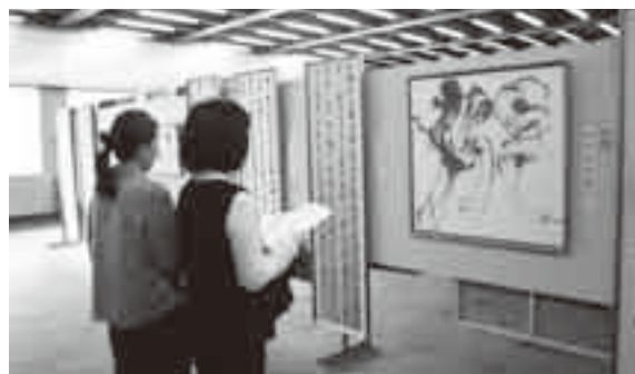
力作が並ぶ展示会

*1 搬入は9月30日(日)午前9時30分から同会場で。 ※一部出品料などのかかるものがあります。出品希望などくわしくは生涯学習課文化振興室へ。