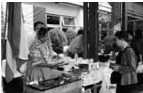
各国の料理も並ぶ国際市民フェスティバル