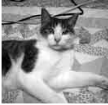
ペットも家族の一員です