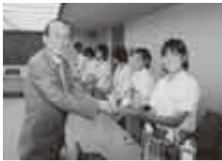
西中学校陸上部の生徒に花束を贈る小泉市長

を持って市内の金融機関(郵便局は除く)へ申し込んでください。 ※くわしくは環境衛生課(☎20-1531)、下総・大栄地区の人は香取広域市町村圏事務組合(☎0478-78-1181)へ。