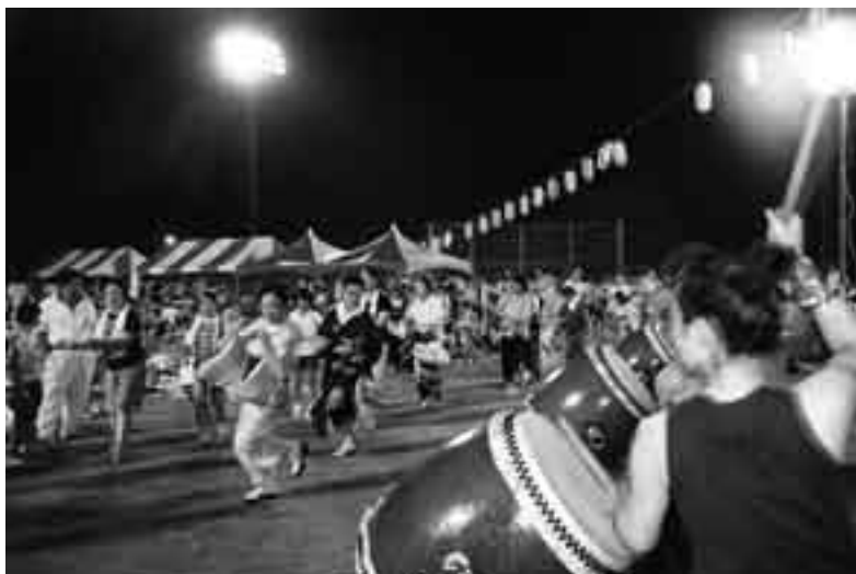
みんなと一緒に盆踊り

下総ふるさとふれあい納涼まつりが8月16日、下総運動公園野球場で開かれ、会場一帯はおよそ3,000人の人出でにぎわいました。訪れた人たちは、特設ステージでのクイズ大会や抽選会、広場での盆踊りなど多彩なイベントを満喫。フィナーレを飾る打ち上げ花火が夜空を鮮やかに染めると、至るところで歓声が上がりました。