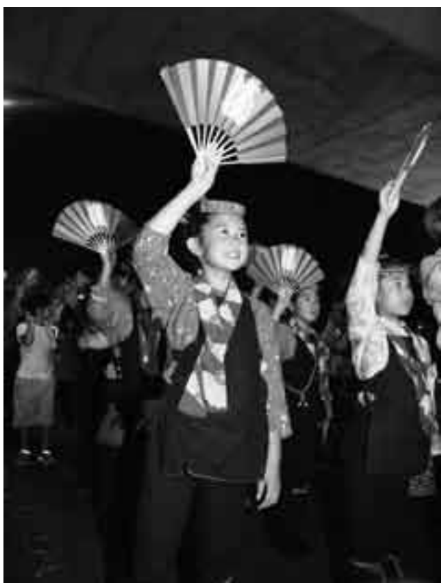
張り切って総踊り