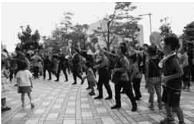
公津の杜駅前でも踊りを披露

地域の親睦を深めるイベントとして親しまれ、今年で20回目を迎える飯仲ふれあい祭りが8月26日に開催されました。晴天となった夏空の下、参加者たちは手作りの山車を引きながら威勢のいい掛け声とともに地区内を巡回。公津の杜駅前では「笹踊り」や「神前の舞」など地区独自の踊りも披露され、多くの見物客から盛大な拍手を送られていました。