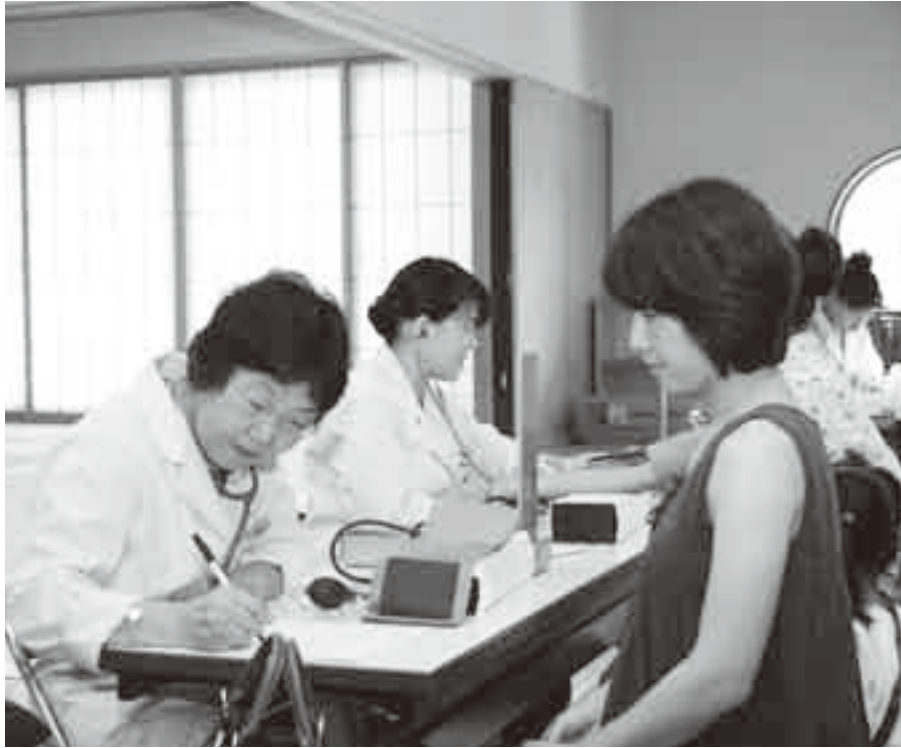
早期発見・早期治療に役立てて

市では、市民の皆さんの健康づくりに役立ててもらおうと、成人検診・女性の検診を実施しています。今年度の検診日程も半分が終了しました。集団の成人検診は12月まで実施していますが、女性の検診は11月までです。まだ受けていない人は、早期発見・早期治療のためにも、積極的に検診を受けましょう。