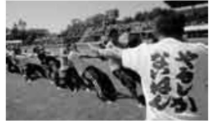
「やるしかないねん」

※種目や申し込み方法については、区・自治会・町内会へ回覧板でお知らせします。くわしくは生涯スポーツ課(☎20-1584)へ。