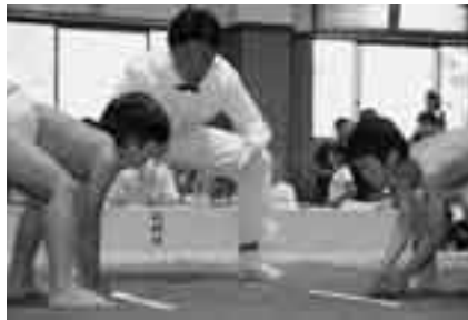
「見合って見合って」