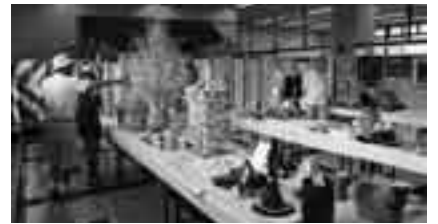
出品作品を参考に来年は出品してみたい