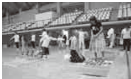
意外な才能を発見できるかも

日時＝9月23日(日・祝) 午前9時～正午 会場＝市体育館アリーナ 実施種目＝ユニカール・フォークダンス・ペタンク・グランドバレー・バウンドテニス・ラージボール卓球など ※参加費は無料です。参加を希望する人は当日直接会場へ。くわしくは生涯スポーツ課(☎20-1584)へ。