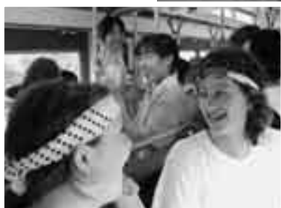
レトロバス内では成田国際高校の生徒が英語でガイドを