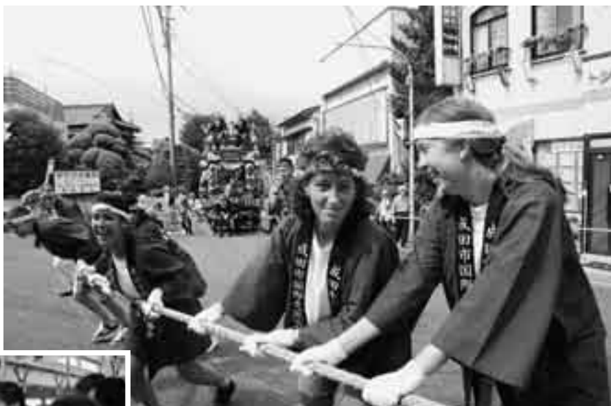
山車引きにも挑戦

姉妹都市サンプルーノ市から中学生友好訪問団が7月1日から9日にかけて成田市を訪れました。参加したサンプルーノ市パークサイド中学校の10人はホームステイを通して日本の生活や文化を体験。成田祇園祭へ参加した後は、レトロバスに乗り込み、市内の観光スポットを巡りました。車内では観光ガイドとして同乗した成田国際高校の生徒から節分や市内の特産品、成田空港などについて、クイズを交えて英語で説明を受けるなど市内各地で交流を深めました。