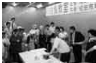
さばき方の実演も