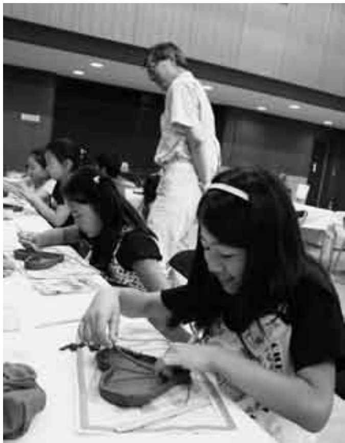
どんな風にしようかな？