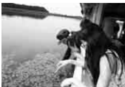
印旛沼の自然を間近で

※申し込みは成田の水をきれいにしよう 運動推進協議会事務局(環境計画課・ ☎20-1533)へ。