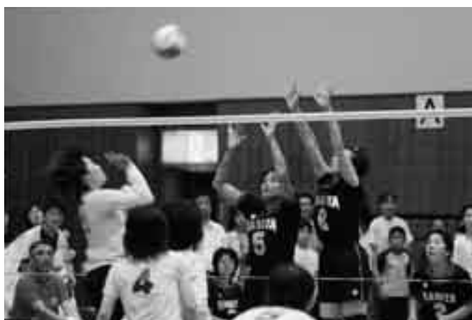
迫力のプレーで魅せる