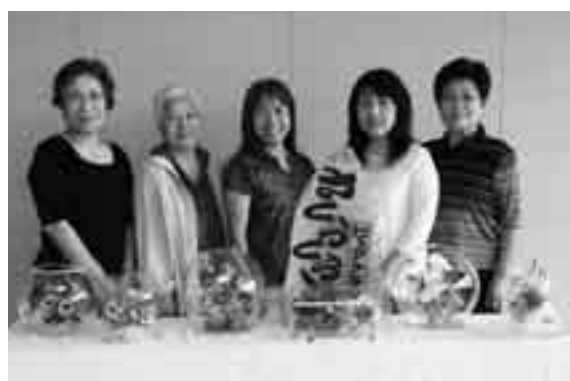
ピュアフラワーで日々の生活に潤いを

ならでは。自宅の庭で好きな花を種や苗から育て、美しさのピークを迎えたときに作品に仕上げる、そんな楽しみ方もできるんですよ。今まで数々の花を題材に作ってきましたが、特に思い入れが強いのは、誕生日や記念日などに大切な人からいただいた花で作ったもの。そのときの思い出とともにずっと傍らで愛でることができ、心に安らぎを与えてくれます。