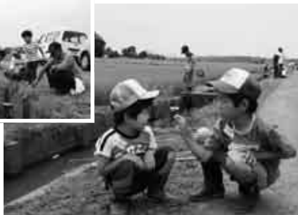
見て。大きいでしょ