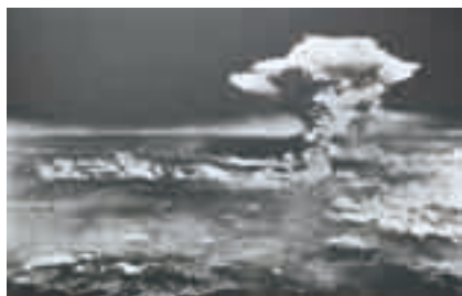
終戦の月に平和の尊さをかみしめよう