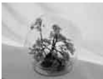
可憐な桜も永遠に

10月には、公民館主催で開催される教室で講師を務めます。花が大好きな人、「ピュアフラワー」を一緒に作ってみませんか。