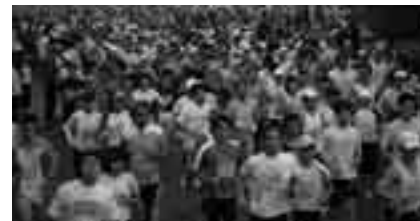
みんなでスポーツ健康都市宣言!