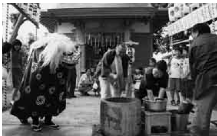
拝殿前でのもちつき

5年前に拝殿と本殿の改修が計画され、改修工事が続いていた三里塚浅間神社。その工事が完了したとたん6月30日、例祭に先立って落慶式が行われました。当日は新しくなった社殿に多くの参拝客が訪れ、午後から開催された宵宮祭ではもちつきや地元の天神囃子会によるお囃子などが祭りを華やかに演出し、境内は終始にぎやかな雰囲気になっていました。