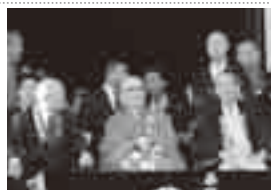
成田祇園祭で総踊りを観覧する小泉市長