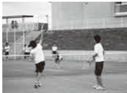
ネットを隔ててボールを打ち合う自由練習

わたしたち久住中学校男子ソフトテニス部は1年生14人、2年生9人、3年生3人の計26人で活動しています。