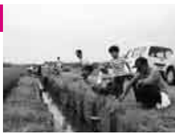
えびがに、食い付いてこーい

下方の田園地帯で6月30日、公民館による親子体験教室が開かれ、10組28人の親子が竹ざおとスルメを手にえびがにつりを楽しみました。どの組も釣果は好調で、一番釣った親子は2時間でなんと199匹。「昔を思い出し腕が鳴った」というお父さんは「こうした機会が減って残念。子どもたちには自然とずっとふれあってほしい」と話していました。