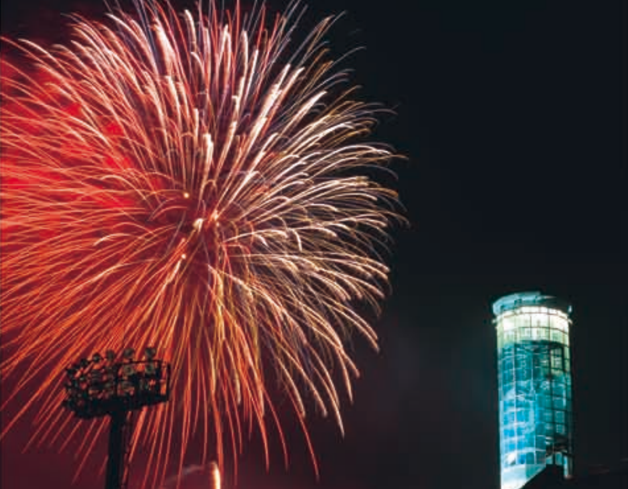
夏の夜を彩る大輪の花火