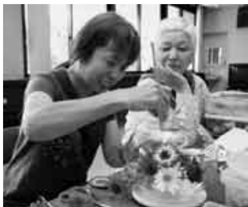
アレンジはセンスと腕の見せどころ

ピュアフラワーは、生花を乾燥させガラスの器に閉じ込めたもの。ドライフラワーの一種ですが、ガラスに密閉され湿気に触れないので、良好な状態のまま長持ちするのが特長です。また、咲き誇る花にその美しい姿のまま永遠の命を吹き込めるのもピュアフラワー