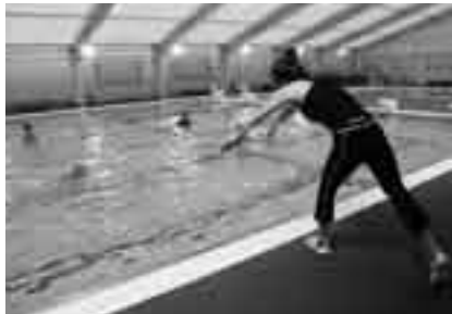
水中での有酸素運動は効果抜群

※水着とキャップを各自用意してください。申し込みは生涯スポーツ課(☎20-1584)へ。