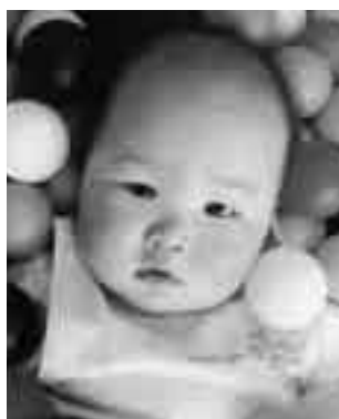
小貫 真凛ちゃん(中台)

性格が正反対の二匹。最初はけんかが多かったですが、最近は落ち着いてきた感じです。心は本当の兄弟のようにつながっているのかもしれませんが。