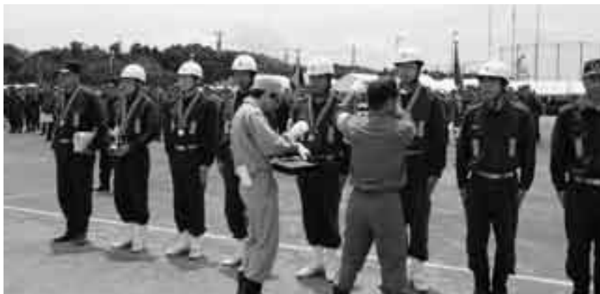
ポンプ車の部・並木町チーム

第27回(財)千葉県消防協会印旛支部消防操法大会が7月1日、北羽鳥多目的広場を会場に開催され、先の成田市消防操法大会で優勝した並木町(ポンプ車の部)、飯田町(小型ポンプの部)両消防団が成田市代表として参加しました。この大会に向けて厳しい練習を重ねてきた両チームは、本番でも素晴らしい操法を披露。ともに準優勝に輝き、7月28日(土)に千葉県消防学校(千葉市中央区)で行われる第43回千葉県消防操法大会に印旛支部代表として出場することになりました。