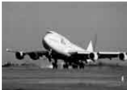
ジャンボジェット機を間近で

期日＝8月2日(木) 集合時間と場所＝午前9時・市役所1階ロビー 見学コース＝成田消防署、麻薬探知犬訓練センター、空港第1ターミナル(昼食)、リサイクルプラザ・いずみ清掃工場 対象＝小学生と保護者 定員＝30人(先着順) 参加費＝無料(昼食は各自用意) ※申し込みは広報課(☎20-1503)へ。