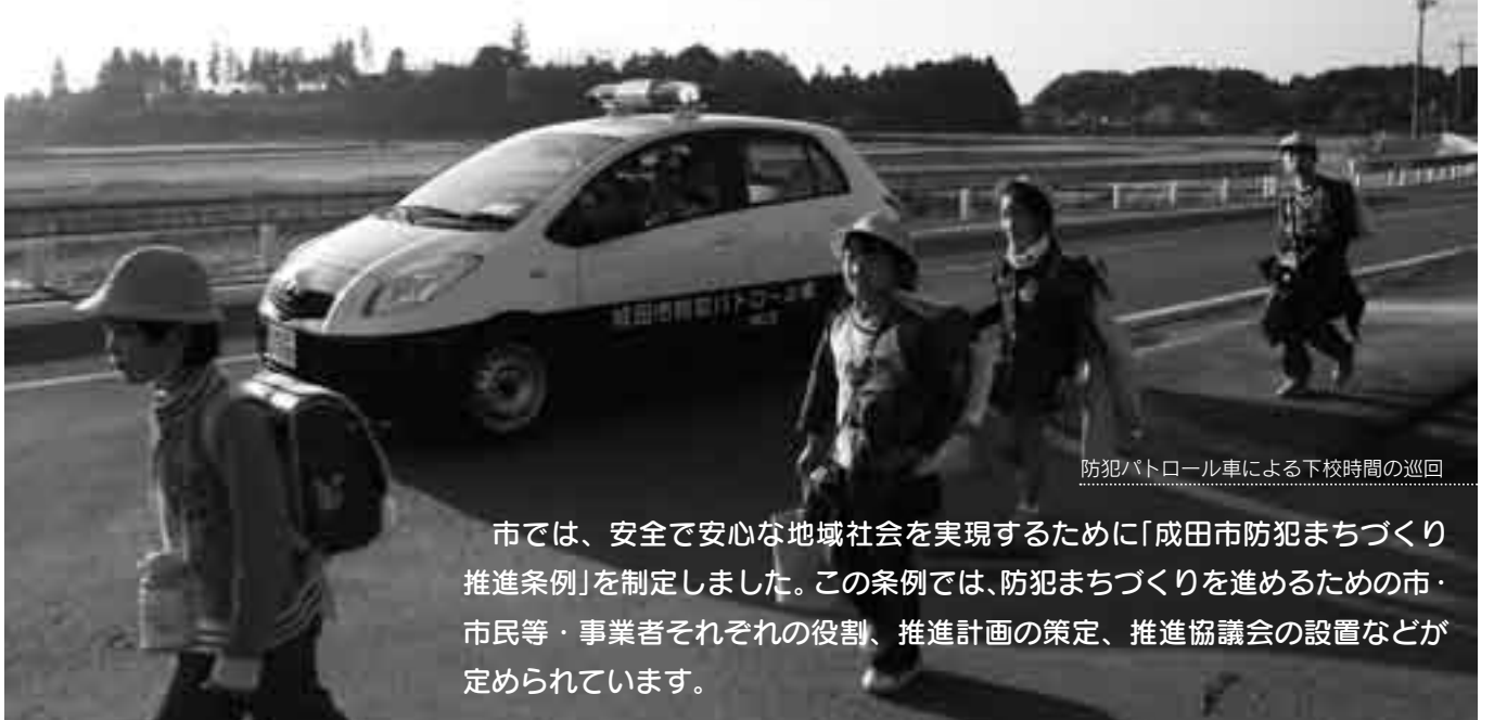
防犯パトロール車による下校時間の巡回

市では、安全で安心な地域社会を実現するために「成田市防犯まちづくり推進条例」を制定しました。この条例では、防犯まちづくりを進めるための市・市民等・事業者それぞれの役割、推進計画の策定、推進協議会の設置などが定められています。