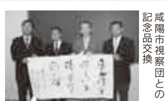
咸陽市視察団との記念品交換