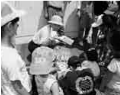
太陽熱つてすこいんだよ

日時=8月4日(土)(雨天時は5日(日) 午前10時30分~午後1時 会場=子ども館ふれあいひろば 内容=太陽の光を集めて料理などを行う 対象=市内在住の小学生以上 定員=20人(先着順) 参加費=50円(材料費) ※申し込みは子ども館(☎20-6300、月曜日・第3日曜日は休館)へ。