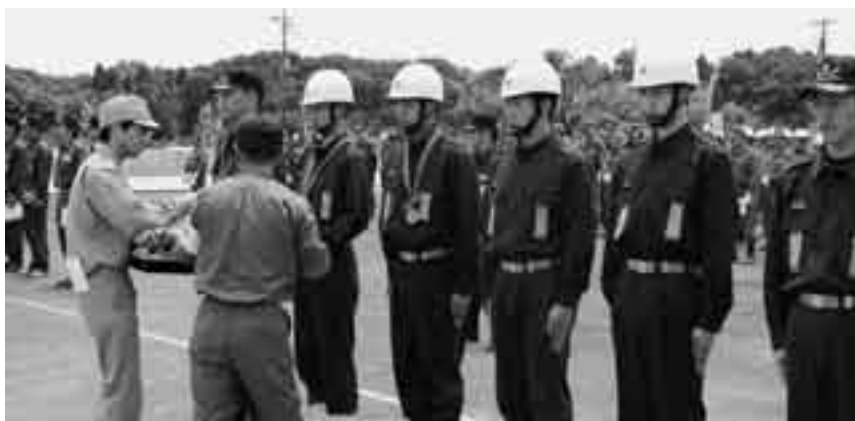
小型ポンプの部・飯田町チーム