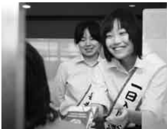
審査ブースでパスポートを渡す