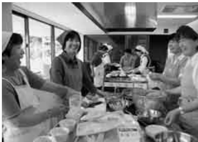
梅を刻んで梅マヨネーズづくり