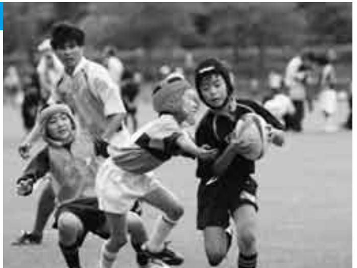
果敢にトライを狙う成田チャオズの選手

成田市近隣(成田・印西・千葉・匝瑳)のスポーツ少年団ラグビークラブが市球技場に集まり6月10日、交流大会が開かれました。子どもたちは、U-12(12歳以下)とU-10(10歳以下)に分かれリーグ戦方式により熱戦を展開。青々としたピッチ上に「あきらめるな!」「行け!」と歓声を響かせていました。