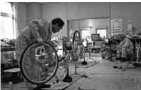
リサイクルプラザでの自転車の再生

自治会や子ども会などの団体でリサイクル活動に取り組む団体を募集しています。原則として毎月1回活動を行い、集めた資源物の重量に応じて団体に奨励金(1kgにつき10円)が交付されます。平成18年度末時点で登録団体は156団体です。