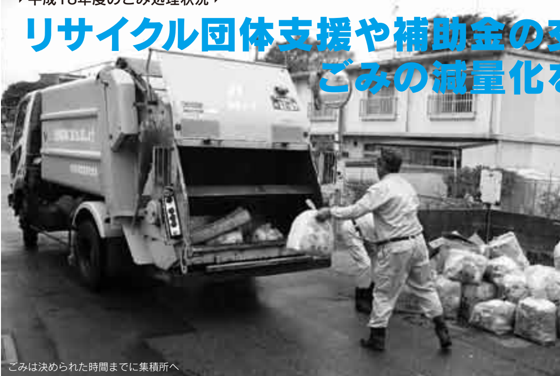
ごみは決められた時間までに集積所へ

ごみの減量化やリサイクルは、わたしたちの日常生活でも身近で大切な問題となってきました。今回は、市のごみ処理の現状と、ごみを減らすための取り組みについてお知らせします。