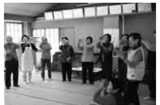
地域の皆さんとふれあいながら