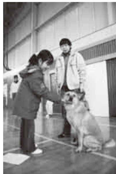
愛護センターによる「動物愛護教室」

※ペット霊園は現在合同墓地のみ使用できます。料金は永年で3,150円ですので併せてご利用ください。申し込みは八富成田斎場(☎23-4511)へ。