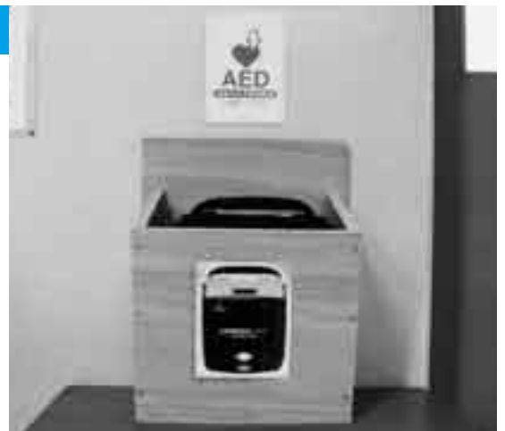
急な事故や病気に対応(成田中)

学校行事などでもしものことがあった場合に備え、AED(自動体外式除細動器)が4月に、市内の全市立中学校に設置されました。市では今後、教職員への研修を通じて生徒の思いがけない事故や病気に迅速かつ適切な対応ができるよう取り組んでいきます。AEDは急な不整脈などにより心停止した場合、電気ショックを与えて心臓の機能を正常な状態に戻す医療機器で、市役所本庁舎、保健福祉館、市体育館などにも設置されています。