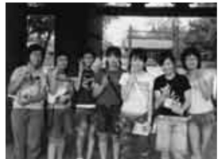
異文化を肌で感じよう

※国際情勢などの事情によって、中止となる場合があります。くわしくは同協会事務局(広報課内・☎23-3231)へ。