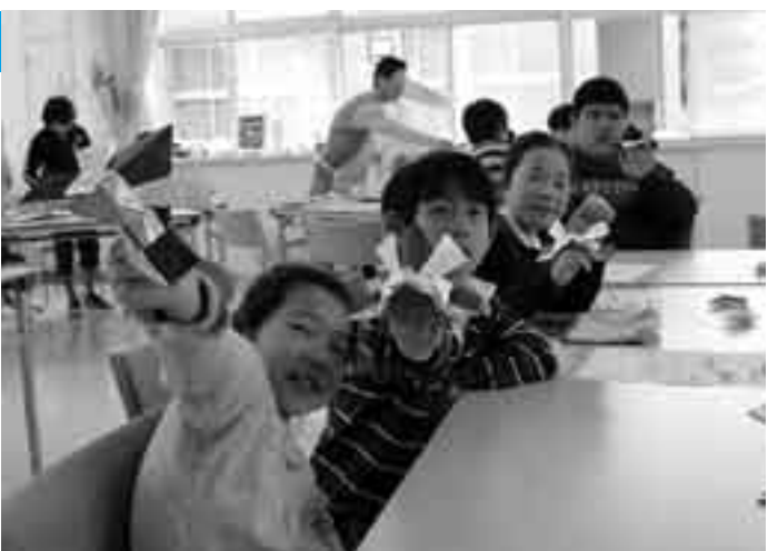
きれいに折れたよ

端午の節句を前に「かぶと・こいのぼり作り教室」が4月21日、子ども館で行われました。参加した子どもたちは最初にかぶととこいのぼりの話を聞くと早速、牛乳パックに思い思いのデザインを描くこいのぼり作りと金銀鮮やかな色紙を使ったかぶと作りそれぞれに挑戦。およそ1時間半かけて作品を完成させると「玄関かテレビの上に飾りたい」、「かぶとをぬいぐるみにかぶせたい」とうれしそうに話していました。