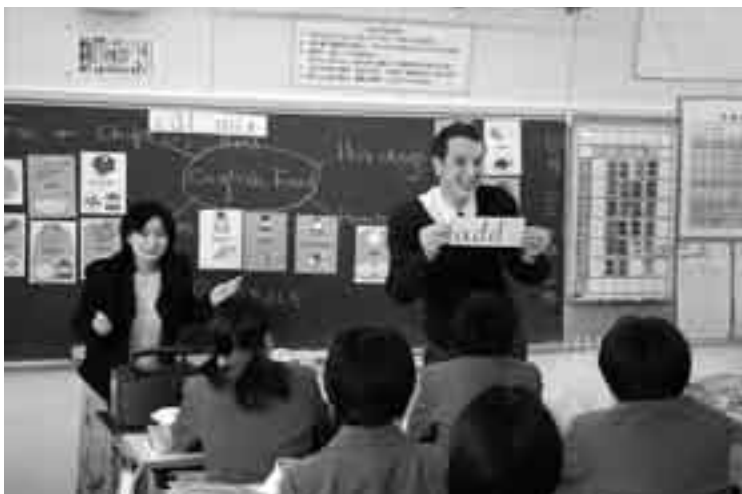
実践的な授業で英語をより身近に(吾妻中)