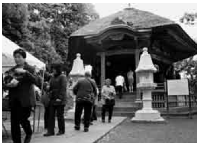
松崎や宝田地区からも訪れる人が