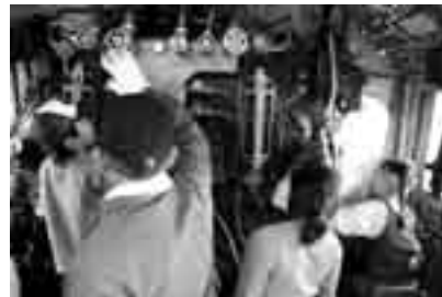
D51を動かす機関に興味津々

栗山公園ではおなじみの風景となったミニSL無料乗車イベントが4月15日に行われ、たくさんの親子連れが同公園を訪れました。石炭を燃やし蒸気を吹き上げ、汽笛を鳴らして走るミニSLは小さいながらも迫力満点。乗車待ちの人たちが列を作るほどの人気で、何度も待って繰り返し乗車する姿も見られました。また、常設展示されているD51型蒸気機関車では、無料開放のほか運転室で元機関士による解説が行われ、子どもだけでなく大人も興味深く見聞きしていました。このミニSL運行とD51の開放は毎月(12月・1月を除く)1回実施され、今回は5月27日(日)の予定です。