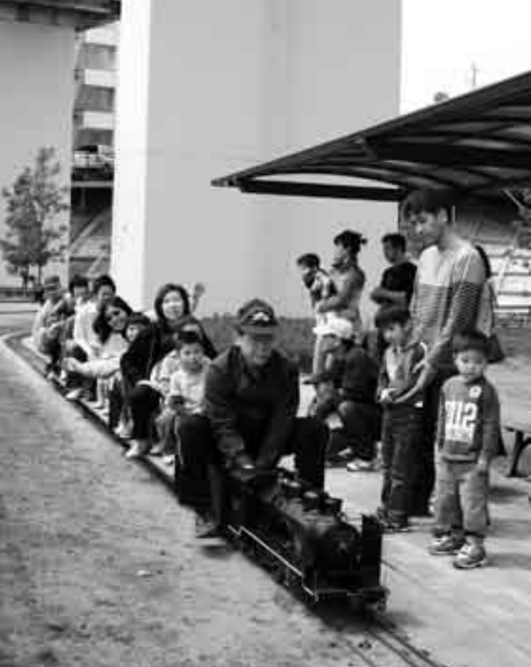
汽笛を鳴らして出発進行