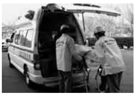
救急車を本当に必要とする人のために

症状や、事故の状況から急いで病院へ連れて行ったほうが良いと思ったときには、迷わず119番通報をしてください。