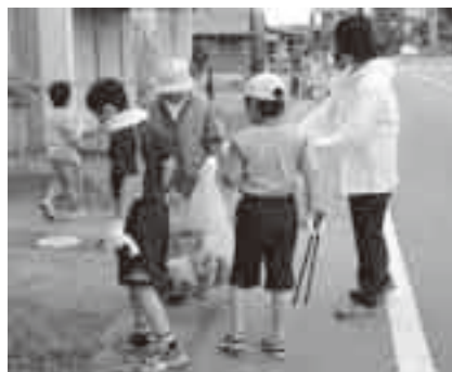
みんなで街をきれいにしよう