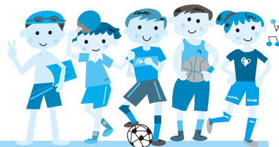
SPORTS LEADER BANK

市ではスポーツレクリエーション活動の普及推進を目的とし、指導者の登録・紹介などを行う「スポーツリーダーバンク」を設置しています。さまざまなスポーツ活動において、指導者を探している団体などに登録指導者の紹介を行っています。また、技術指導・能力を提供できる人で「スポーツリーダーバンク」に登録してくれる人を募っています。 ※くわしくは生涯スポーツ課(☎20-1584)へ。