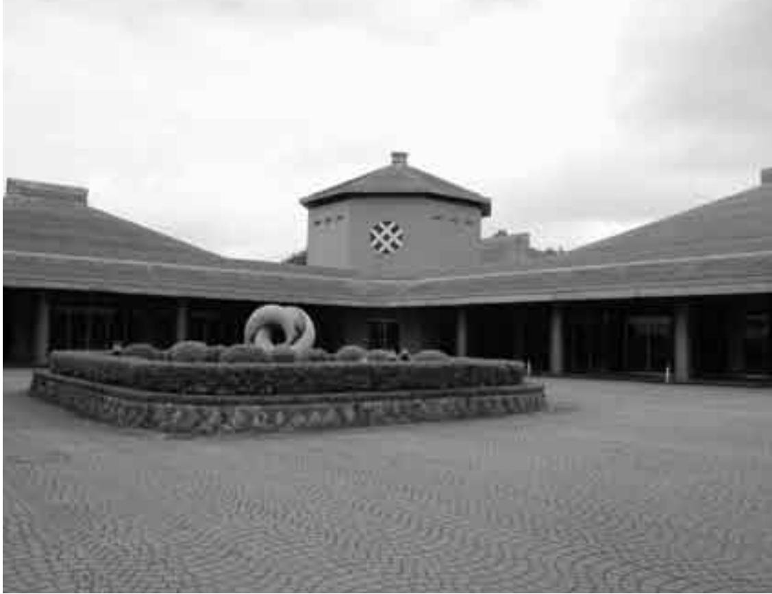
静かな環境にある八富成田斎場