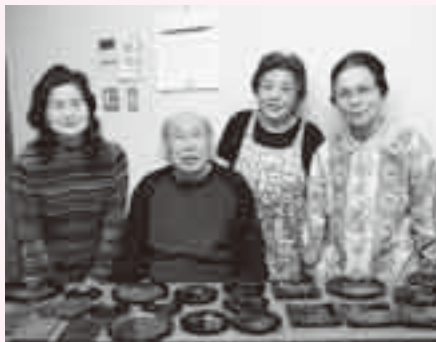
贈り物にも喜ばれますよ

根気良く丹念に磨き上げていきます。地塗りが終わると、次は絵付けです。絵柄は、日本の伝統的な技法である蒔絵を用いて花や植物を施します。薄い和紙に描いた絵に漆を塗って器に転写し、そこに金粉を蒔き、立体感を表現。巧緻な技術が求められるので、細心の注意を払いながら仕上げていきます。最後に漆を塗って乾かし、炭で磨き上げたら完成です。蒔絵は、漆が放つ鈍い光沢とまばゆいばかりの金粉がとても美しく、どこか神秘的。出来上がった作品は、自宅に大切に飾ってあるんですよ。 活動を始めて早いもので、13年目を迎えました。これまで数々の作品を作ってきましたが、まだ熟練の技へは道半ば。これからも創作を続けて、見る人の心を奪う、そんな作品に一步でも近づくとが目標ですね。