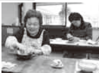
磨くほど美しさが