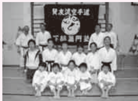
空手を通じて仲間づくり