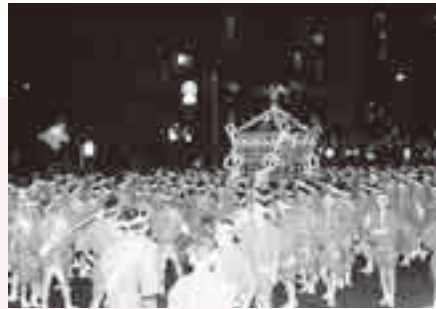
鳥越神社の千貫御輿

祭りのクライマックスは、宮元神社前の蔵前橋通りを、弓張ちようちんで飾られた神輿が進んでいき