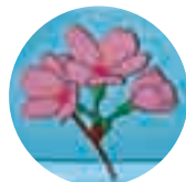
遠山ルート サクラ