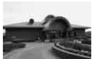
下総運動公園内の下総歴史民俗資料館

時間＝午前7時20分四谷共同利用発から午後6時00分四谷共同利用着まで（3方面それぞれ一日2回ずつの循環に、朝・夕の名古屋方面の一部区間往復1回を1台で運行、所要時間約35分）