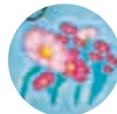
しもふさ循環ルート コスモス