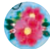
津富浦ルート サザンカ