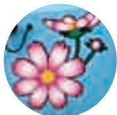
水掛ルート コスモス