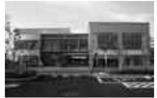
三里塚コミュニティセンター

時間＝午前6時55分三里塚コミュニティセンター発から午後7時55分三里塚コミュニティセンター着まで（1台で6往復運行、所要時間約45分）