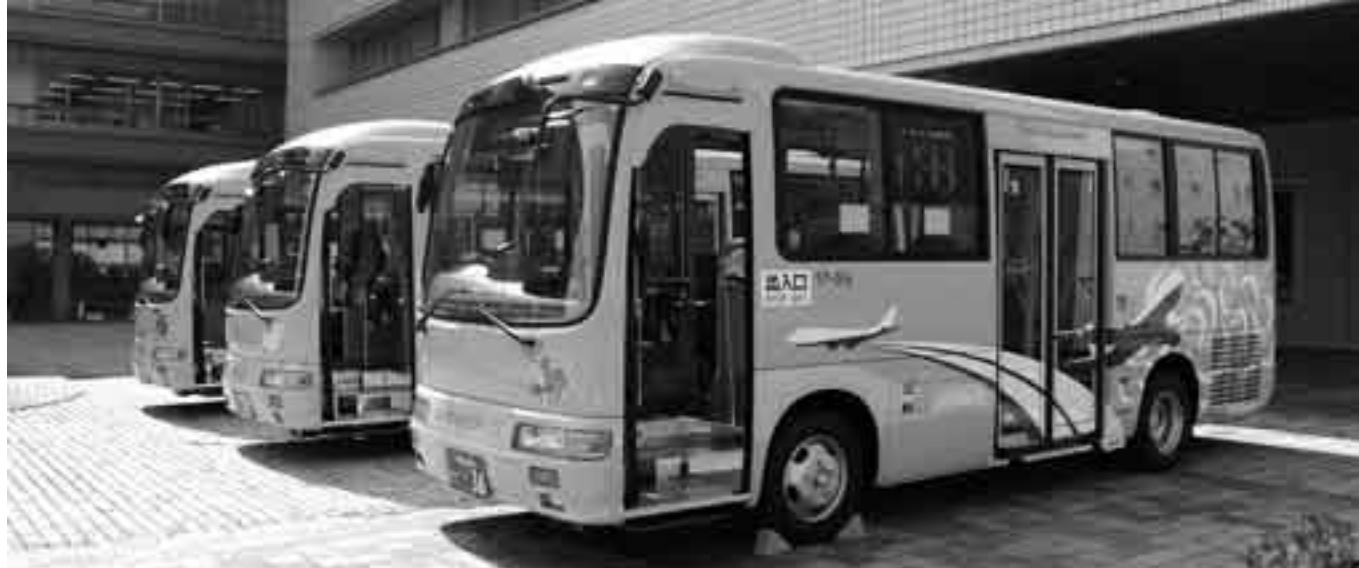
花のマークが行き先の目印に