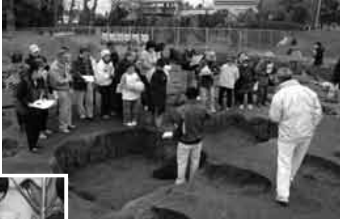
熱心に話を聞く参加者