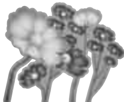
コスモスはしもふさ循環ルート