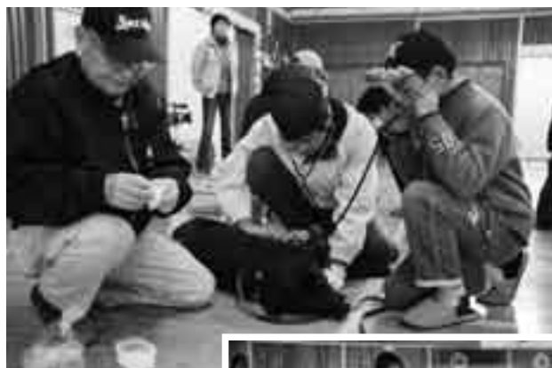
人間と犬の心音は違うかな？

小雨のばらついた3月17日、吾妻小学校体育館で子どもセンター主催の動物愛護教室が開催されました。これは子どもたちに命の大切さを学んでもらおうと、県動物愛護センターの協力により行われたもので、当日は小学生の親子など33人が参加。可愛い犬たちと楽しくふれあいながら正しい接し方やしつけなどを学ぶ一方、捨てられた動物たちがたくさん処分されているという悲しい現実に参加者は真剣に耳を傾けていました。