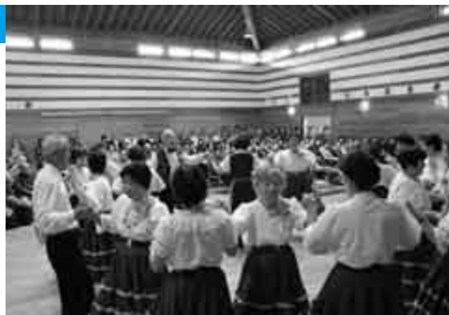
元気にダンスを踊る出演者の皆さん

老人福祉センターを拠点に活動しているサークルが一堂に会して、日ごろの成果を発表する「シルバーいきいきフェスティバル」が3月10日、保健福祉館で行われました。多目的ホールで行われた発表の部では、色鮮やかな衣装を身にまとった出演者が生き生きとしたダンスや楽器の演奏を披露。ホール内を埋めた観客から大きな拍手が送られていました。また、サークルの皆さんが作成した絵や書道などの展示、茶道の実演などもあり、会場内は1日中、にぎわいを見せていました。