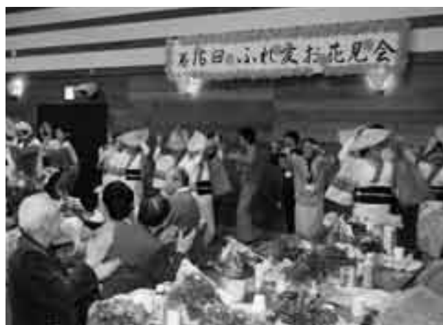
終始にぎわいが絶えない会場

吾妻、加良部、橋賀台、玉造、中台のニュータウン5地区の親睦を深め合う第16回ふれ愛お花見会(共催：各地区社会福祉協議会)が3月24日、保健福祉館で行われました。約180人が集まった会場は、琴の演奏や参加者自身も踊りの輪に加わった阿波踊りなどを通して次第に和やかな雰囲気。桜の花がほころび始めた季節、思い思いの会話に花が咲いていました。