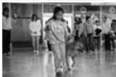
実際に犬と散歩する練習も