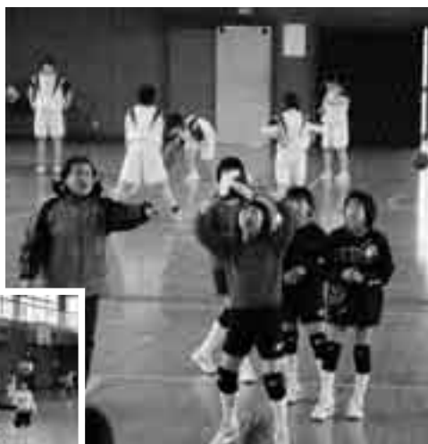
素早くボールの下に回りこんでトス