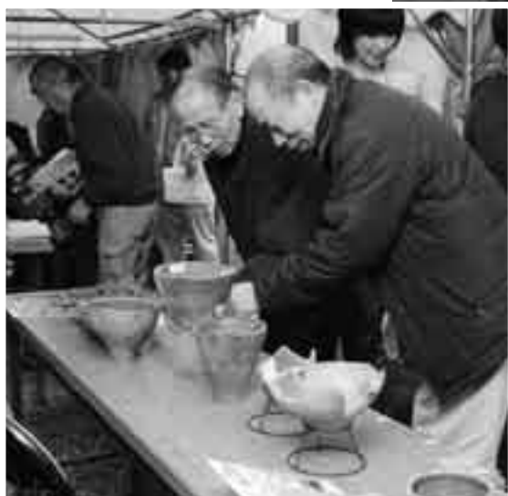
この土器は何に使われたのかな？

南羽鳥地区の区民会館建設に伴い発掘調査が進められていた南羽鳥花輪内遺跡の現地説明会が3月17日に行われました。遺跡からは、縄文時代中期から後期(約4000〜3000年前)の住居跡、「地下式坑」と呼ばれる中世の貯蔵庫や火葬施設などが確認され、訪れた約200人は形や深さが異なる大小の穴の使用目的などについて盛んに質問していました。また、出土した土器や石器なども展示され、参加者たちはこれらを手に取りながら当時の暮らしに思いを巡らせていました。