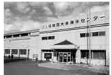
ぜひご利用ください

大栄B&G海洋センターでは、ゴールデンウィーク期間も次のとおり開館しますのでご利用ください。開館日＝5月2日(水)～6日(日) 対象施設＝アリーナ・武道場・会議室、運動場(多目的広場)、テニスコート4面 ※くわしくは大栄B&G海洋センター(☎73-5110・月曜日は休館)へ。