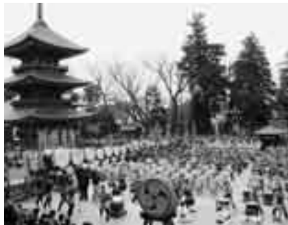
迫力に満ちた和太鼓の演奏