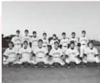
チームの絆を大切に

普段の練習は、シートノックやトスバッティングなど基本練習を中心にしています。これからは、フリーバッティングや連携プレーなど、より実戦に近い形での練習にも取り組み、近隣の中学校との練習試合にも出掛ける予定です。