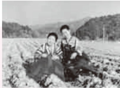
故郷の白菜畑で妹と

今でも忘れられないのが真冬のキムチづくり。一軒の家で白菜を二百〜三百個使います。家族はもちろんのこと近所の人にも協力してもらい一気に漬けます。現在ではキムチ専用の冷蔵庫があります。昔は庭に穴を掘り「はがり」と呼ばれる1m以上もある大きな陶器の入れ物に詰め保存しました。成田に移り住み約20年。生活環境が整備され、とても便利で住みやすい町だと感じています。自然が多くそしてきれいな町ですね。今では成田が第一のふるまです。