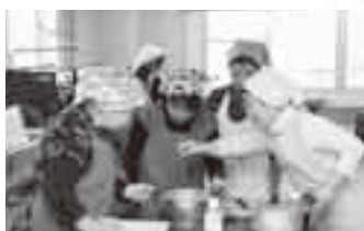
このとろみがポイントよ