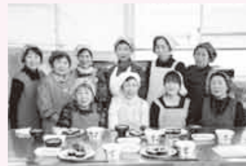
ヘルシー料理で健康に

苦労もしましたが、どうにか3品を完成。中でも、太巻き寿司は桃の花が鮮やかに彩られ、かわいらしく出来上がりました。肝心の味はというと、こちらも文句なしに合格点。今度は、家族一緒に挑戦してみたいと思います。