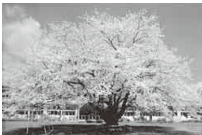
東小学校のシンボル“遠山桜”

成田国際空港建設で多くの住民が学区外へ移転し、現在37人の市内最小児童数の学校となった今でも、遠山桜に対する愛着は変わることなく、昇降口に飾られた卒業記念刺繍作品や遊び場マップ、季節の掲示板に描かれています。