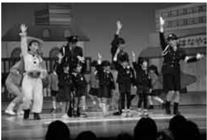
道路の正しい渡り方を体験