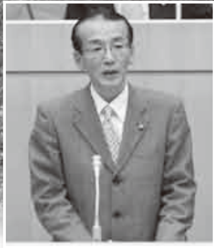
議会冒頭に所信表明演説をする小泉市長