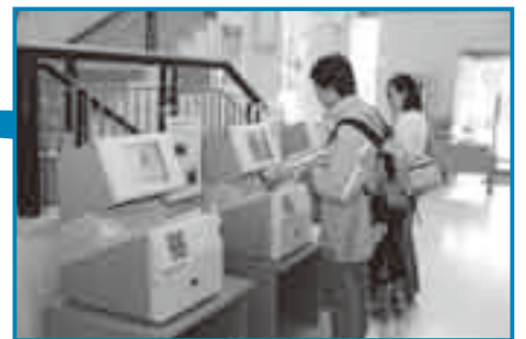
簡単に手続きができます