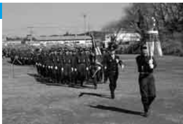
きびきびとした部隊行進

防火意識の啓発を目的に消防出初め式が2月11日、国際文化会館で行われ、消防団員など約1,100人、車両約70台が集結しました。晴天の下、式典では、消防活動に貢献した消防関係者への表彰や部隊・車両行進と中高層火災を想定した消火・救出訓練が行われ、参加者はことし一年の防火への決意を新たにしました。また、成田高校付属小学校の児童と音楽隊の演技も行われ、会場から暖かい拍手が送られました。