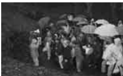
文化財の現地学習も(地域社会課程)

申し込み方法＝3月23日(金)(必着)までに、はがきに希望する課程名(1人1課程)・住所・氏名・年齢・職業(市外の方は勤務先や学校名も)・電話番号を書いて生涯学習課「明治大学係」(〒286-8585 花崎町760)へ