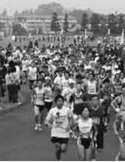
大勢の市民ランナーが参加するPOPラン

本市ではスポーツを愛し、スポーツを通して健康な心と体を育み、明るく豊かな市民生活を実現するため「スポーツ健康都市」を宣言いたしました。スポーツを通して健康増進を図ることも肝要であり、高血圧や糖尿病といった生活習慣病は、食生活の改善や適度な運動などにより予防することができるといわれています。今後も引き続き生涯スポーツ・レクリエーション活動の推進と各種スポーツ施設の整備・充実に努めてまいります。