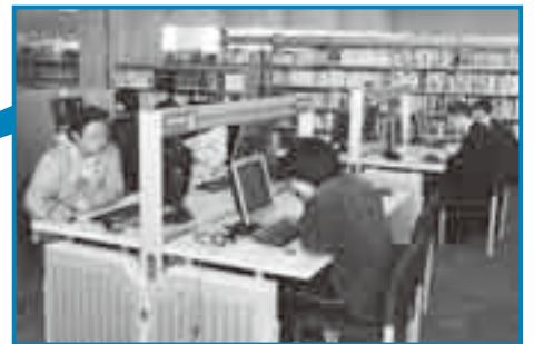
インターネットが利用できます