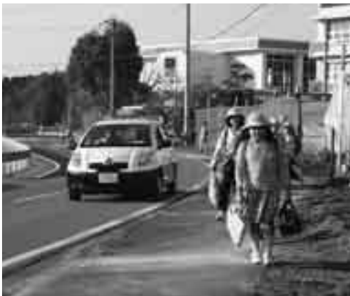
下校時間にあわせ通学路防犯パトロール車が巡回

防犯対策につきましては、平成16年7月から防犯巡回指導員制度を発足し、同年12月からは青色回転灯パトロール車による防犯パトロールを開始、昨年9月からは、通学路防犯パトロールを実施しています。さらなる防犯対策の充実を図るため、関係機関との協働によるパトロール体制を強化するとともに、市内協力事業者による防犯啓発活動や自主ボラ