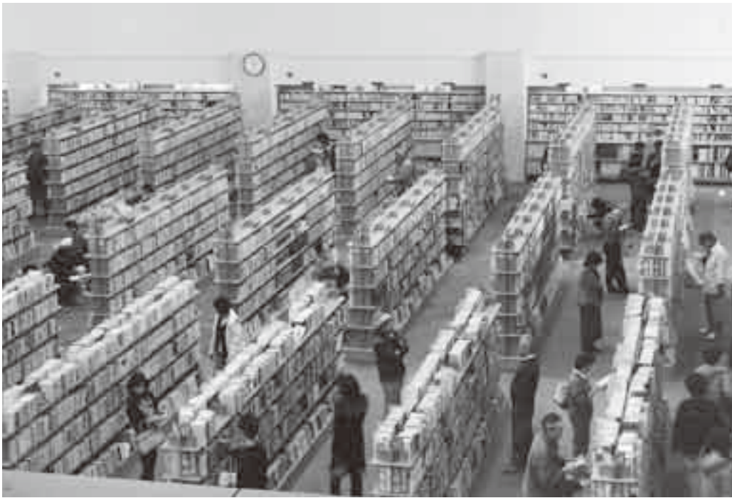
約78万冊もの蔵書がある市立図書館

市立図書館では、3月1日から新サービスを開始しました。また、4月1日からは、インターネットで本の予約などができるようになります。これらのサービスを活用し、読書ライフをさらに充実させてみませんか。