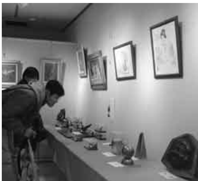
見事な作品に思わず身を乗り出して鑑賞