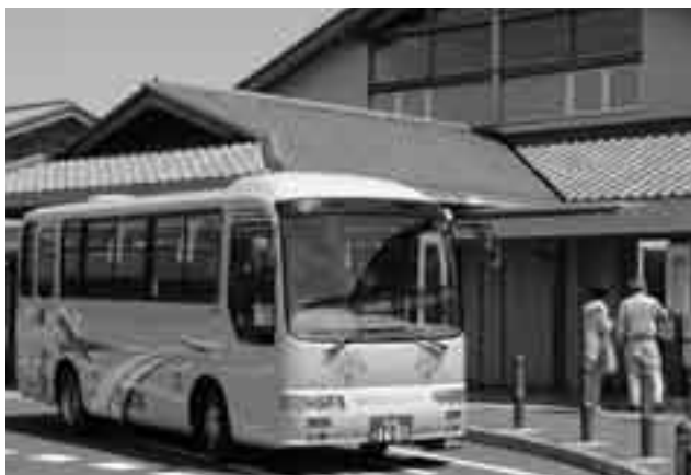
路線の拡充でさらに便利になったコミュニティバス

コミュニティバスは、昨年の12月から実証運行が始まっている豊住ルートが本年4月に本格運行に移行することから、市内6路線に拡充されます。今後も、交通不便地域と市街地の公共施設を結ぶ交通手段としてコミュニティバスの充実に努力してまいります。