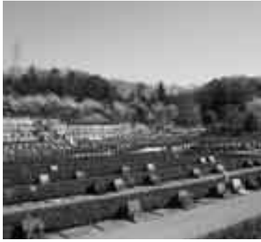
管理の行き届いた墓地