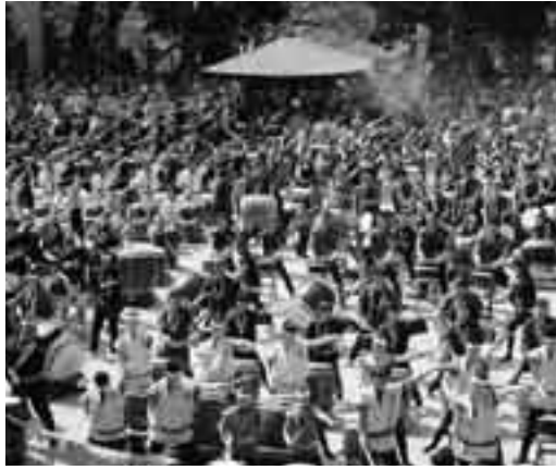
300人以上の打ち手が集まる太鼓祭の千願華太鼓

観光は地域の活力や文化を内外に発信する有力な手段であり、地域経済に刺激を与え、地域の未来を切り開きます。本市は、成田山新勝寺をはじめとする多くの寺社、成田国際空港、豊かな自然など恵まれた観光資源を有しております。私も国際空港を抱えるまちのトップセールスマンとして、観光のまち成田を国内外に売り込み、幅広い観光客の誘致と『訪れて良し』と来成者に満足していただける観光行政を積極的に展開し、観光立市を推進してまいります。