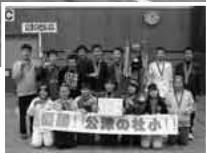
初優勝した公津の杜ブレイズチーム