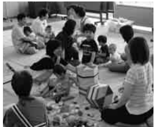
子育てひろばでは親同士の情報交換も

高齢者福祉につきましては、高齢者がいきいきと安心して暮らせるよう保健、医療、福祉の充実を図り、また社会参加の推進など、