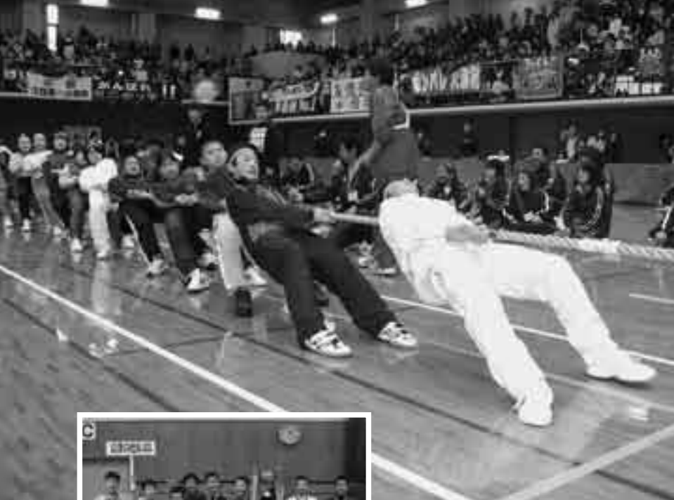
息を合わせて綱を引く