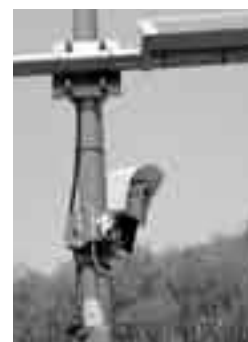
設置されているカメラ

市では、不法投棄監視員や職員によるパトロール、さらには監視カメラの設置や警備会社による夜間パトロールを行い、不法投棄の防止に努めています。