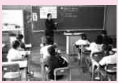
少人数学習推進教員によるきめ細かな授業

図書などの備品の管理については、管理簿が調整され、おおむね現況の記載がされているものと認められた。