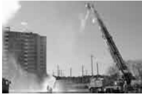
はしご車による放水訓練

ことしも式典のほか、消防隊による迫力ある訓練や消防音楽隊と成田高校付属小学校ダンス部による演奏・演技、子どもたちに毎回好評の特殊消防自動車への体験乗車を行います。 当日は、サイレンを鳴らしますので、火災と間違わないようご注意ください。