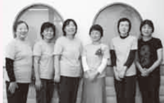
一緒に活動してくれる人、大歓迎です

「ありがとう!」「また来るね!」という一言が、わたしたちの何よりの原動力。親子の笑顔が溢れるひととき、そしてお母さんたちから届けていけたらうれしいですね。