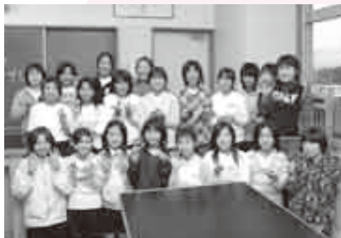
みんなのアイデアを形に

材料は100円ショップで買ってき たものや木の実などを利用して、なるべくお金をかけないようになっていますが、その分、みんながアイデアを出し合い、楽しみながら作るよ