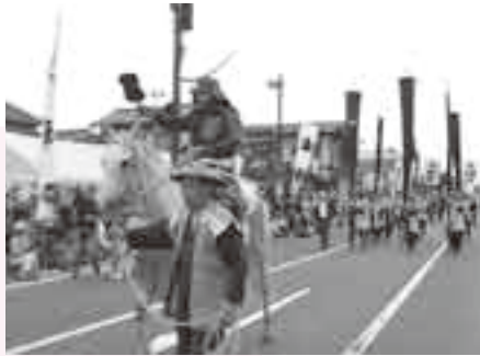
勇壮な「政宗公まつり」

靴は下駄の歯を取り、そこに銚 かすがい を差し込んだもの。田んぼに水をまき二日も経てば、分厚い氷が張り特設リンクの完成です。高校時代は友達と自転車に乗り、鳴子溪谷によく行きました。何といっても秋の紅葉シーズンは最高でした。溪谷一帯が赤や黄色に染まり、その眺めは絶景ですね。滑川に来て40年弱。雪がないだけでとても暮らしやすいと感じていますが、冬の筑波からの空っ風はとても寒いですね。