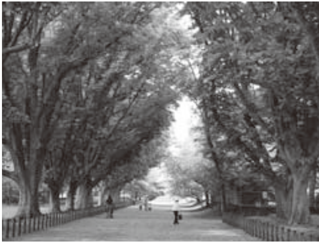
三里塚記念公園のマロニエ並木