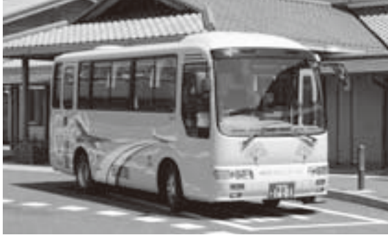
市民の足として活躍するコミュニティバス