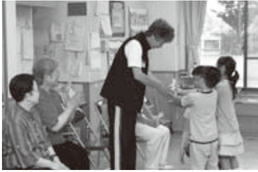
世代を超えたふれあい