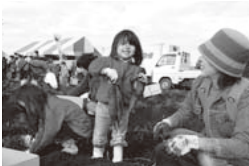
成田の特産品サツマイモ