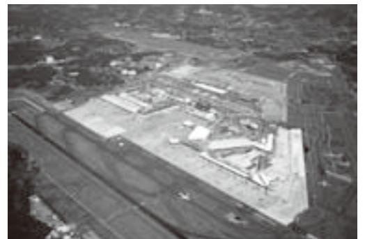
完全化が待たれる成田国際空港