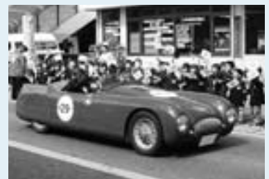
さまざまなクラシックカーが参加します