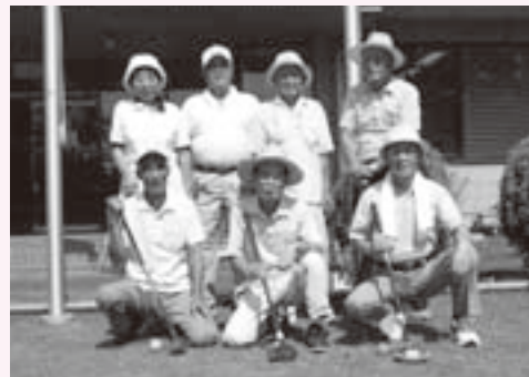
秋の大会に向けてがんばってます

グラウンドの状態を読みきれず玉が思いもよらぬ方向にいつてしまったり、コースは狙いどおりでもホールポストを通過してしまったり：上達への道はまだ続きません。でも、スコアはあまり気になりません。澄んだ青空と「カーン」という乾いた打球音。それがグラウンドゴルフの一番の醍醐味ですから。