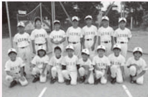
吾妻の星を目指します

ときには厳しいこともあるけど、おかげで、野球を始めたときは近くまでしか投げられなかったボールも今ではだいぶ遠くまで投げら