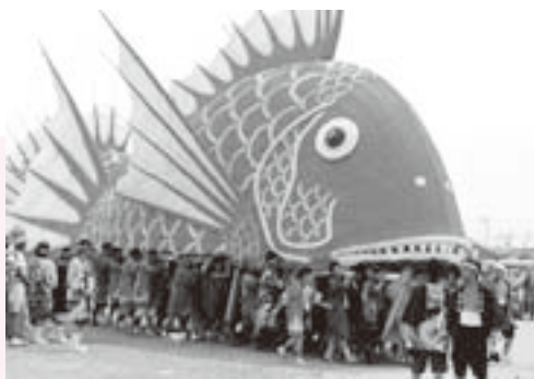
長さ15m、重さ約1tを越す巨大な鯛みこし

100人で担ぎ、町中や海中を練り歩きます。大きいものは、全長15m、高さ5m、幅3mと巨大で、目玉には色を塗ったアルミの洗面器が使われます。みこし同士のぶつかり合いなどもあり、海の男たちの勇壮な姿は圧巻です。