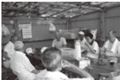
汗を流した後の休憩は格別

トを設置。ポストの配置によって、難易度も自在に設定できるので、常に新鮮な気持ちでプレーに臨めます。各ホールは最長でも50mほどですが、ラウンドを重ねれば、歩く距離は3キロにも。無理をせず休憩をとりながらゆっくり回るので、いい運動になりますよ。