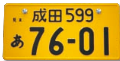
軽自動車用ナンバープレート