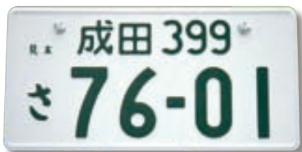
普通自動車用ナンバープレート

今月から従来の千葉・習志野・袖ヶ浦・野田と並んで、「成田」・「柏」のナンバーを付けた自動車も日本中を走ることになります。「成田の車は行儀が悪い」と言われないように、この機会に交通ルールや運転マナーを改めて確認し、安全運転を心掛けましょう。