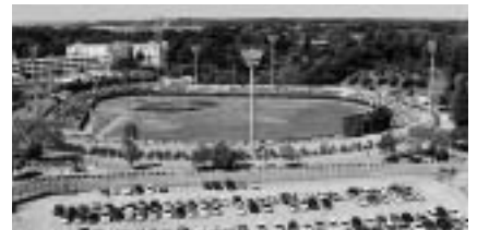
ナイター設備も完備しています

日時 = 3月1日(水) 午前9時から 会場 = 市体育館会議室 貸し出し期間 = 3月20日(月)~4月30日(日) くわしくは市体育館(☎26-7251)へ。