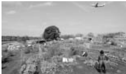
土と親しんで野菜作りを楽しもう