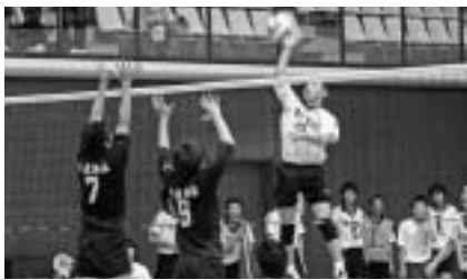
チームプレーで勝利をつかめ!

期日 = 3月19日(日) 会場 = 市体育館アリーナ 競技方法 = 一般男・女6人制によるトーナメント方式 参加費 = 3,000円(1チーム当たり) 組み合わせ抽選は、市バレーボール協会で行い、後日抽選結果を送付します。申し込みは3月3日(金)までに電話で市体育協会事務局(生涯スポーツ課・☎20-1584)へ。