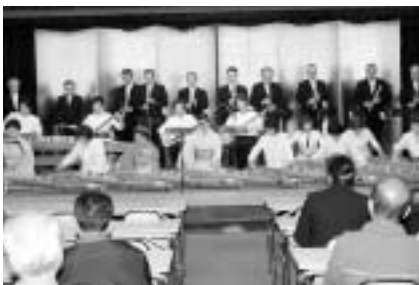
市民文化祭での発表も