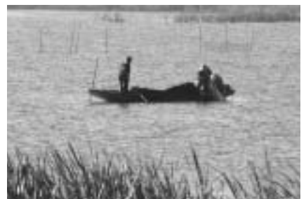
印旛沼の自然を取り戻そう