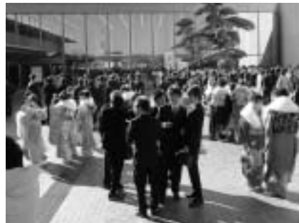
懐かしい人との再会も

市内在住者には12月初旬に案内状を送付します。転出された人には案内状が届きませんので、生涯学習課(☎20-1583)までご連絡ください。くわしくは同課へ。