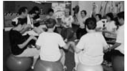
介護予防にも軽い運動は最適です

日時 = 11月30日(水) 午前9時30分~11時30分 会場 = 市体育館 対象 = 中・高齢者 内容 = ボールなどを使用した筋力トレーニングやストレッチ 参加費は無料です。申し込みは前日までに電話で市体育館 ☎26-7251、月曜日・祝日の翌日は休館)へ。