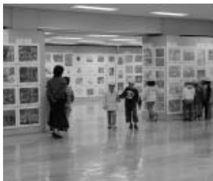
世界各国の絵画が一堂に展示されます

第8回国際こども絵画交流展を次のとおり開催しています。世界各地の子どもたちと市内の子どもたちの絵画作品を通して、お互いの生活や文化について交流を深めます。 期間 = 11月23日(祝)まで 時間 = 午前9時~午後3時30分 会場 = 成田山新勝寺大本堂第二講堂 入場は無料です。くわしくは生涯学習課 ☎20-1583)へ。