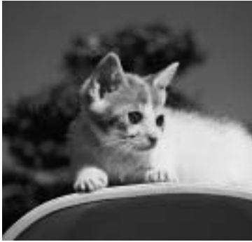
ほくも家族の一員です