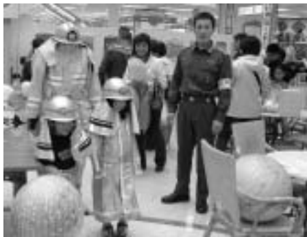
防火服を着てみよう