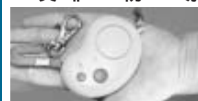
防犯ブザーで安全確保