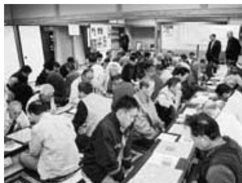
大勢の参加者でにぎわう将棋大会