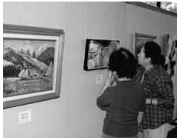
力作が並ぶ美術展