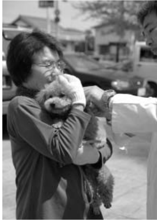
予防注射も飼い主の責任

○犬や猫を飼うときは、終生家族の一員として愛情をもって飼えるかどうか、家族で十分話し合いをしてから飼いましょ。