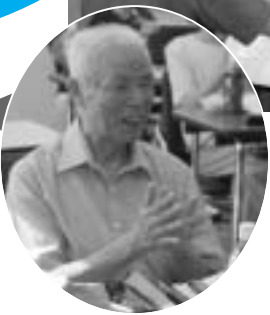
喜びが込み上げる

旅情の5曲の合奏練習と自分の好きな一曲を演奏する通称「名人芸」を披露します。曲のポイントをハーモニカで吹きながら体全体で表現してくれる先生の指導はとても分かりやすいです。秋の御利生祭や公民館まつりなどで演奏会を予定しているのでみんな一生懸命です。