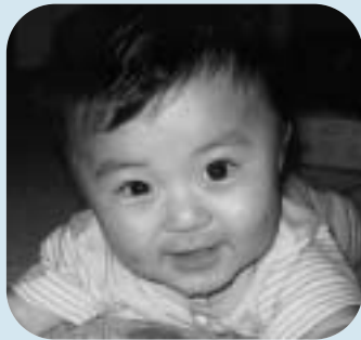
こんにちは 赤ちゃん 107