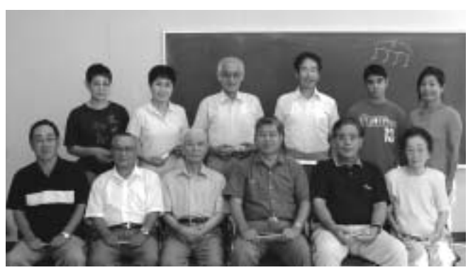
心を癒やしてくれます

旅情の5曲の合奏練習と自分の好きな一曲を演奏する通称「名人芸」を披露します。曲のポイントをハーモニカで吹きながら体全体で表現してくれる先生の指導はとても分かりやすいです。秋の御利生祭や公民館まつりなどで演奏会を予定しているのでみんな一生懸命です。