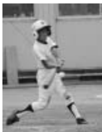
思い切りのいいバッティング

きちんとするように指導されます。「あいつができないければ、スポーツをする権限はない」人の気持ちかわかる、気配りのできる人間になろう。「道具を大切にしよう」これがよく言われることです。