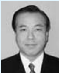
副議長 上田信博氏