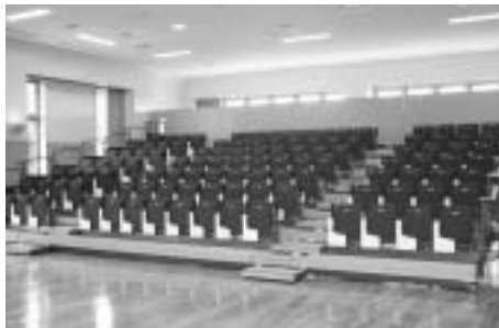
多目的ホールの可動式客席

市民の皆さんに快適に利用していただくために、設計にあたっては、各種団体や一般の人たちからさまざまな意見を取り入れました。多目的ホールには、用途に合わせてスムーズに設営できるように可動式の客席とステージを設置。また、館内のエントランスや通路にもゆとりをもたせ、全体的に明るく開放的な施設となっています。