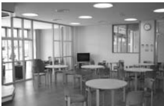
ゆったりとしたサロン