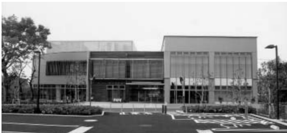
駐車場側から見たコミュニティセンター

市民の多様なニーズに応え、一つの建物にいろいろな機能を備えた複合施設が三里塚に誕生しました。7月1日にオープンした、成田市三里塚コミュニティセンターについて紹介します。