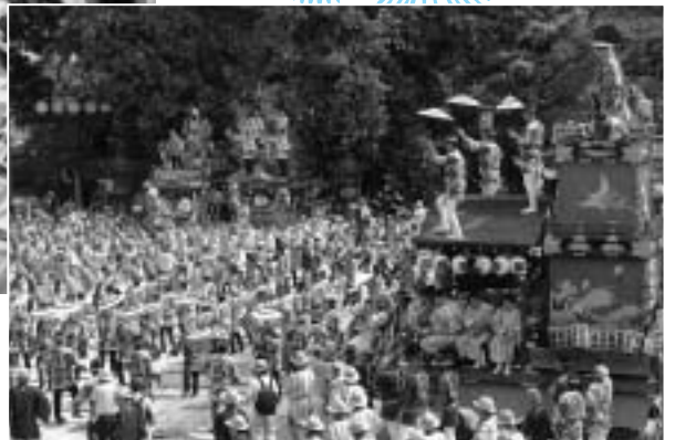
新勝寺大本堂前の総おどり