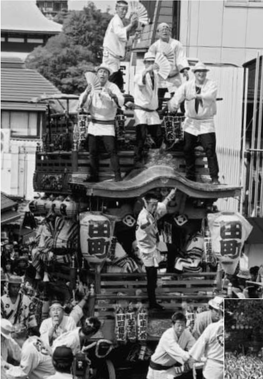
最大の見せ場「総引き」