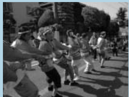
そろいのはんてんでワッショイ

成田観光館では、成田祇園祭に参加する外国人に「はんてん」を無料で貸し出します(先着100人)。くわしくは成田観光館(☎24-3232)へお問い合わせください。