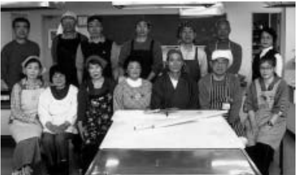
そばづくりを堪能しています

のないバサバサしたものになるので最初から注意が必要です。のとき、水の量はその日の湿度で微妙に変わります。極端な言い方をすれば最後の数滴が勝負の分かれ目です。これはそば打ちの経験がない人には分かりませんね。