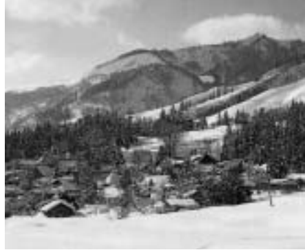
ほとんどの家が民宿に

ちの部屋がなかったほどです。今ではリフトが10基以上ある「温泉スキー場」となり、以前に増して民宿が盛んになっているようです。