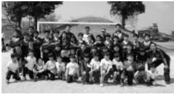
チーム名のように愛されるチームに

入れる予定です。ことしの夏はサンフランシスコに遠征し、ホームステイをしたり、ヨセミテ公園でキャンプをしたり、地元チームと交流試合もします。監督からは、国際交流を通して広い視野をもつて欲しいといわ