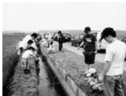
いっぱいつれるかな

申し込みは5月31日(火)までに直接ま たは電話で公津公民館(☎26-9610・ 月曜日は休館)へ。