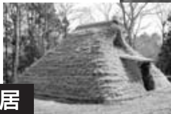
復元された竪穴住居