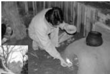
完成後カマドに火が入る