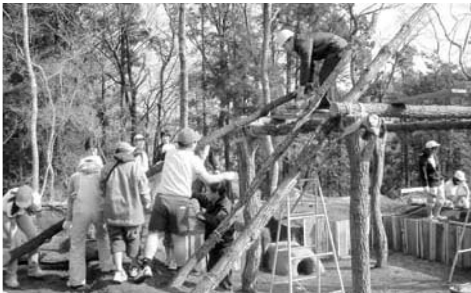
丸太と竹を使って住居の骨組み作業をする小学生とボランティア

この時代の住まいは、地面を50cm~1m掘って萱などを屋根に葺いた半地下式の竪穴住居と呼ばれるものです。形は正方形で一辺の長さは5m。この大きさは古墳時代の標準的な家で、畳14~15枚分に相当します。竪穴住居に入ったことがある人は、そんなに広いのかなと感じるでしょう。それは柱が建物の中にあること