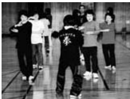
太極拳で気分もすっきり

太極拳は生涯できるスポーツです。健康のために、あなたのライフスタイルに取り入れてみませんか。 日時=5月8日(日)午後1時~4時30分 会場=市体育館 対象=どなたでも 参加費=一般500円、会員・小人300円 申し込みは5月6日(金)までに市体育協会事務局(生涯スポーツ課・☎20-1584)へ。