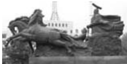
咸陽市のシンボル・始皇帝像

派遣期間 = 8月21日(日)~27日(土) 6泊7日(事前に国内で、宿泊1回を含む6回の研修を予定しています) 派遣先 = 咸陽・西安・北京・上海 応募資格 = 市内に住む小学5年~中学2年生で、事前研修から事後研修に至るまでの計画に従い、規律ある団体行動に適應できる人 定員 = 男女各12人(応募者多数は抽選) 費用 = 110,000円 応募方法 = 5月13日(金)必着)までに応募用紙を郵送で(社)成田青年会議所事務局(〒286-0026 本町342)へ 国際情勢により、行き先などが変更になる場合があります。応募用紙の請求などくわしくは事務局(☎23-1900・E-mail info@naritajc.com)へ。