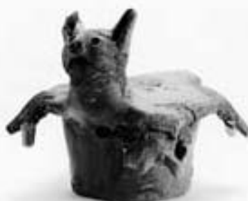
日本で初めて発見されたムササビ型埴輪