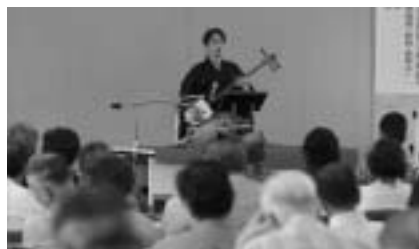
古典芸能に触れる講義も(昨年度の地域社会課程)

申し込み方法 = 3月25日(金)必着までに、ハガキに「明治大学・成田社会人大学への申し込み」であることを明記のうえ、希望する課程名(1人1課程)・住所・氏名・年齢・職業(市外の方は勤務先や学校名も)・電話番号を書いて生涯学習課 ☎286-8585 花崎町760) へ