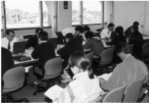
早めの申告にご協力を

なお、所得税の確定申告は、インターネット上の厳格な本人確認が可能な公的個人認証サービスの