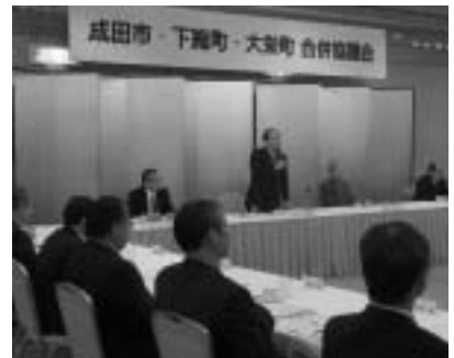
合併に向け調印式も行われます