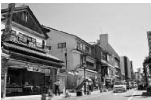
上町表参道街並み風景(市長賞)

たてもの龍門 景観賞：石川邸(山之作)、新町デ イサービスセンター(玲光苑新町)