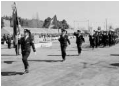
火災のない街を目指して

ことしの消防出初式は、式典のほか、航空機災害用化学消防車を使用した消防隊の訓練、消防音楽隊演奏と成田高校付属小学校ダンス部演技や展示消防車への体験乗車などを行います。見学は自由ですので、ぜひご覧ください。 なお、当日はサイレンを鳴らします。火災と間違わないようにご注意ください。