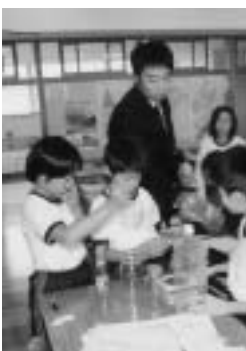
少人数教育で楽しい授業を

意見として、近年学力の低下が懸念されており、教育に対する市民の関心も高まっています。本市