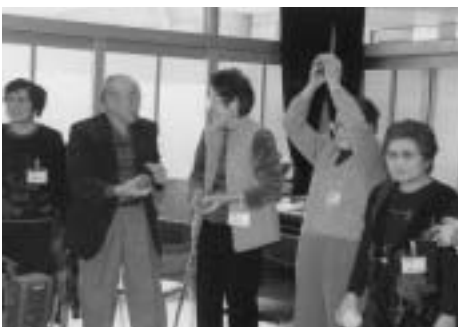
レクリエーションで楽しいひととき

会の企画・運営は、すべてボランティア。年度当初に、年間計画を立て、毎月、実施に向けて準備をします。閉じこもりがちだった高齢者もだんだんに打ち解け、参加者の皆さんは、月に1度のこの会を大変楽しみにしています。また、体調を崩して参加できなくて