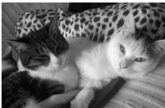
責任を持って飼いましょう

ペットも家族の一員です。愛情をもって終生飼うためにも、次の点に注意して責任をもって飼いましょ。