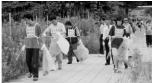
ごみのないきれいなまちに