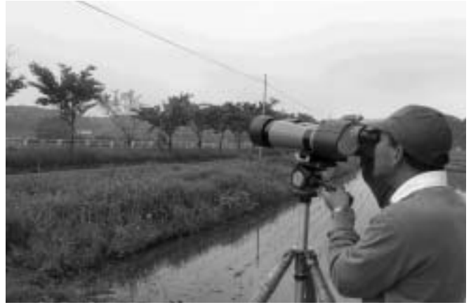
区域の生態系を調べる調査員