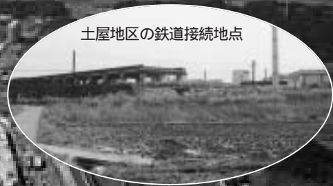
土屋地区の鉄道接続地点

成田空港と都心を結ぶ成田新高速鉄道。それに沿うように整備される北千葉道路。現在、これらの鉄道や道路の整備に先立ち環境影響評価の手続きが行われています。