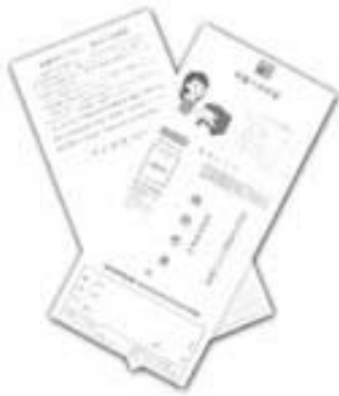
皆さんの「生の声」を