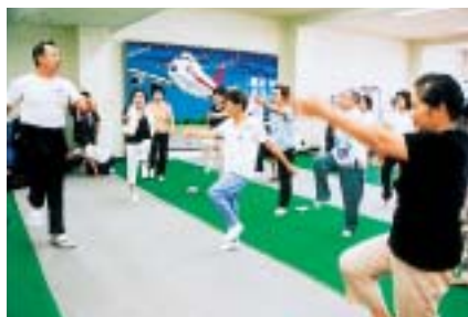
日ごろから身体を動かして

日時＝11月19日(金) 午前9時30分～11時30分 会場＝市体育館 内容＝日常生活の中で簡単に取り組める筋力トレーニングやストレッチで、転倒防止や若返りを図る 対象＝中・高齢者 参加費は無料です。申し込みは前日まで同館 ☎26-7251 へ。