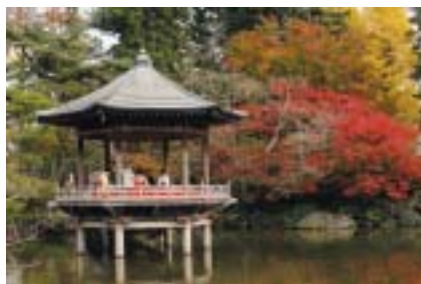
浮御堂では琴の演奏も

内容＝琴・尺八・胡弓の演奏、お茶会、紅葉まつりに関する写真コンテスト くわしくは市観光協会 ☎ 22-2102 へ。