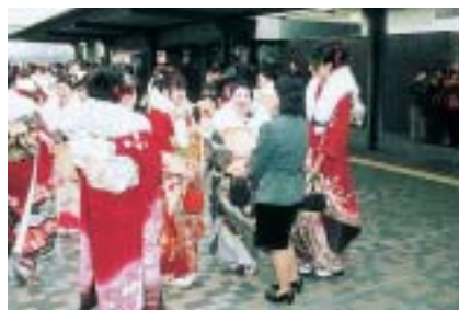
懐かしい人に会えるかな

市内在住者には12月初旬に案内状を送付します。転出された人には届きませんので、生涯学習課 ☎ 20-1583 へご連絡ください。くわしくは同課へ。