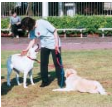
散歩には必ず引き綱を

捨て犬・捨て猫の禁止 捨て犬・捨て猫による苦情が多く寄せられています。ペットは家族の一員です。決して捨ててはいけません。 動物をみだりに捨てること、動物の愛護及び管理に関する法律により罰せられます。