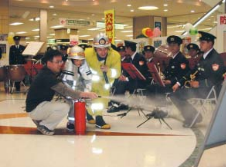
親子で消火訓練 (昨年の防災フェスタで)