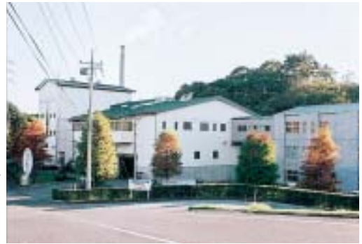
リサイクルプラザ(手前2棟)と いずみ清掃工場(奥)

ごみの減量やリサイクルは、わたしたちの日常生活でとても身近で大切な問題となってきました。今回は市のごみ処理の現状と、ごみを減らすための取り組みについてお知らせします。